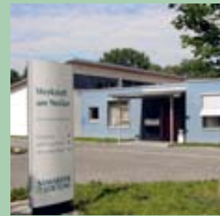
Werkstatt am Neckar