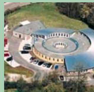
Samariterstift Obersontheim und Fränkische Werkstätten