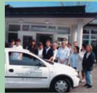
Ökumenische Diakonie- und Sozialstation im Stadtbezirk Sillenbuch