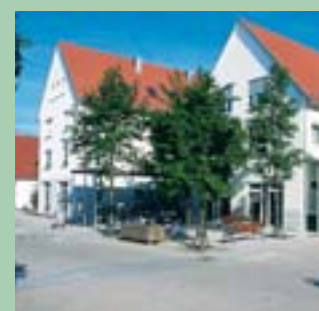
Diakoniestation Gärtringen Samariterstift Gärtringen