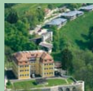
Samariterstift Grafeneck und Werkstatt an der Schanz