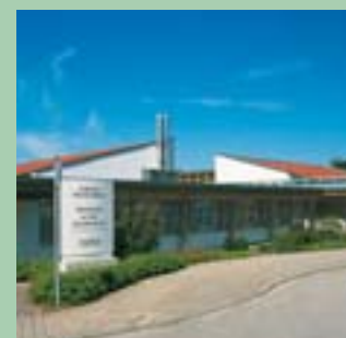
Samariterstift Neresheim, Ostalb-Werkstätten