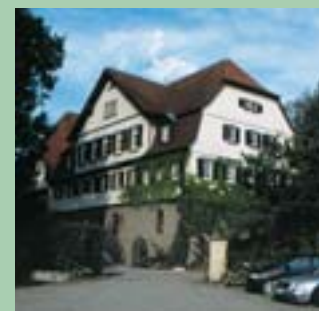
Tagesklinik im Schlöble