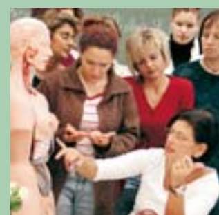
Evangelische Berufsfachschule für Altenpflege