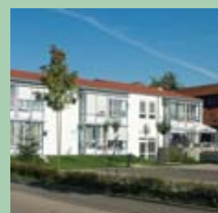
Haus im Park