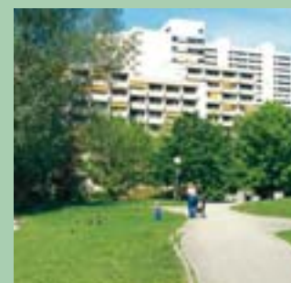
Seniorenzentrum am Parksee