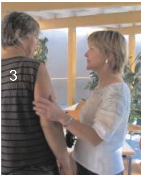
Dies ist Blindtext,