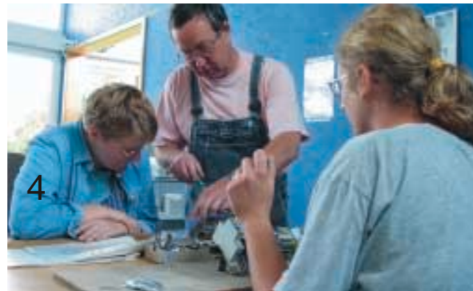
Dies ist Blindtext, Helfende Hände bei der Kabelkonfektionierung