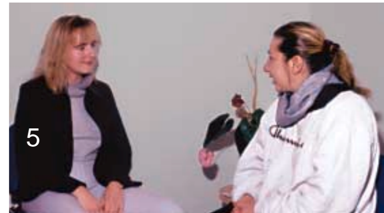
Dies ist Blindtext