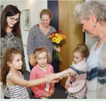
Die Kinder des benachbarten Kinderhauses beim Geburtstags-singen im Kroatenhof (oben).